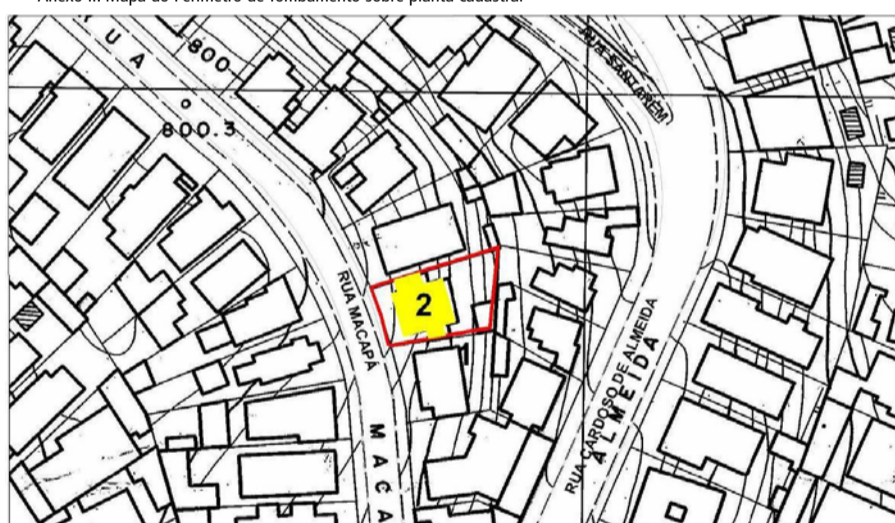
Anexo II: Mapa do Perímetro de Tombamento sobre planta cadastral